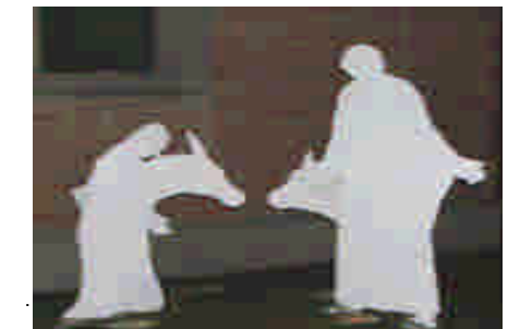
Presepe davanti alla chiesa