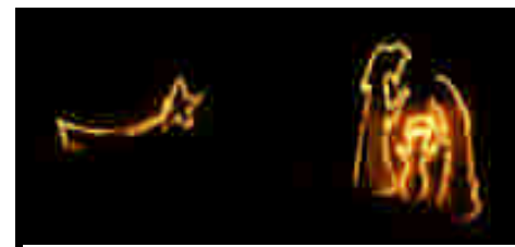
Presepe degli SCOUT Valsanterno che da anni viene realizzato sui gessi della "Paradisa"

Anche la stalla o la grotta in cui Maria avrebbe dato alla luce il Messia non compare nei Vangeli canonici: anche quest'informazione arriva dai Vangeli apocrifi. Inoltre non bisogna dimenticare che la grotta è un ricorrente simbolo mistico e religioso per molti popoli soprattutto del settore mediorientale: una delle più famose divinità persiane, Mitra, nacque proprio in una grotta, il 25 dicembre.