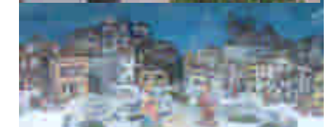
In piazza Unità a cura del Comitato di San Bartolomeo